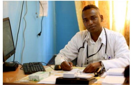
تدعم الوكالة الأمريكية للتنمية الدولية USAID التعليم المستمر للعاملين في مجال الصحة.