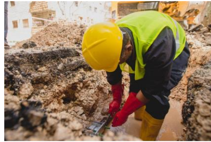
بدعم من الوكالة الأمريكية للتنمية الدولية USAID، تعمل منشآت المياه على تحسين البنية التحتية وتقليل الفاقد من المياه.