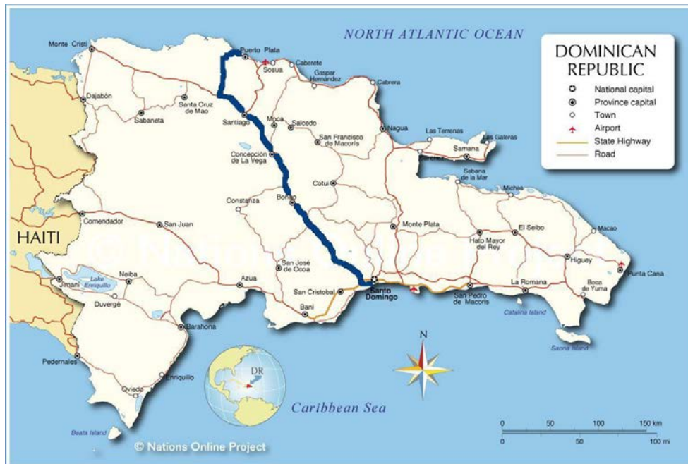
La línea azul destaca el corredor

Aunque la mayoría de los recursos relacionados con los Objetivos de Desarrollo uno (DO1) y Objetivo de Desarrollo dos (OD2) se concentrarán en esta región geográfica, ésta no será exclusiva. En algunos casos, algunas actividades fuera de la región se financiarán como por ejemplo, el trabajo en las ciudades costeras sobre el tema del cambio climático. En cuanto al VIH/SIDA (OD3), la ubicación de poblaciones claves determinará dónde se harán las inversiones y se ofrecerán los servicios vinculados a este sector. Tal y como mencionamos más arriba, algunas de estas poblaciones claves (jóvenes en riesgo y usuario de drogas) pudieran estar concentradas en este mismo corredor urbano pero otras poblaciones claves (gente que cruza la frontera y los/las trabajadores/as sexuales en las zonas turísticas) no necesariamente lo estarían. Por ende, mientras que OD3 podría tener actividades comunes con el OD2 y el OD1 a lo largo del corredor Santo Domingo-Puerto Plata, el OD3 no se limita geográficamente al corredor Duarte.