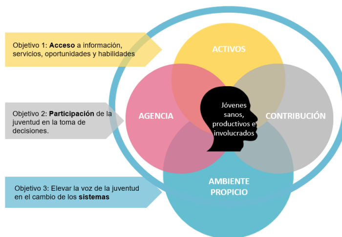
Figura 1: Principios rectores de la Política de Juventud

La Política tiene tres objetivos que se basan en el marco del desarrollo positivo de la juventud. Los principios rectores deben aplicarse a actividades que contribuyan a cualquiera de estos tres objetivos.