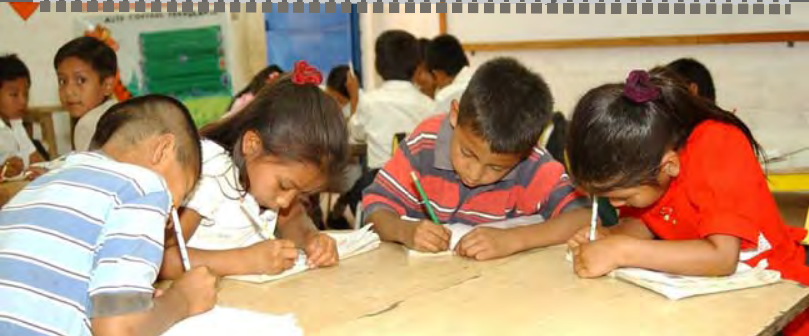
El acceso a la educación fomenta la igualdad de oportunidades para las niñas y los niños salvadoreños.