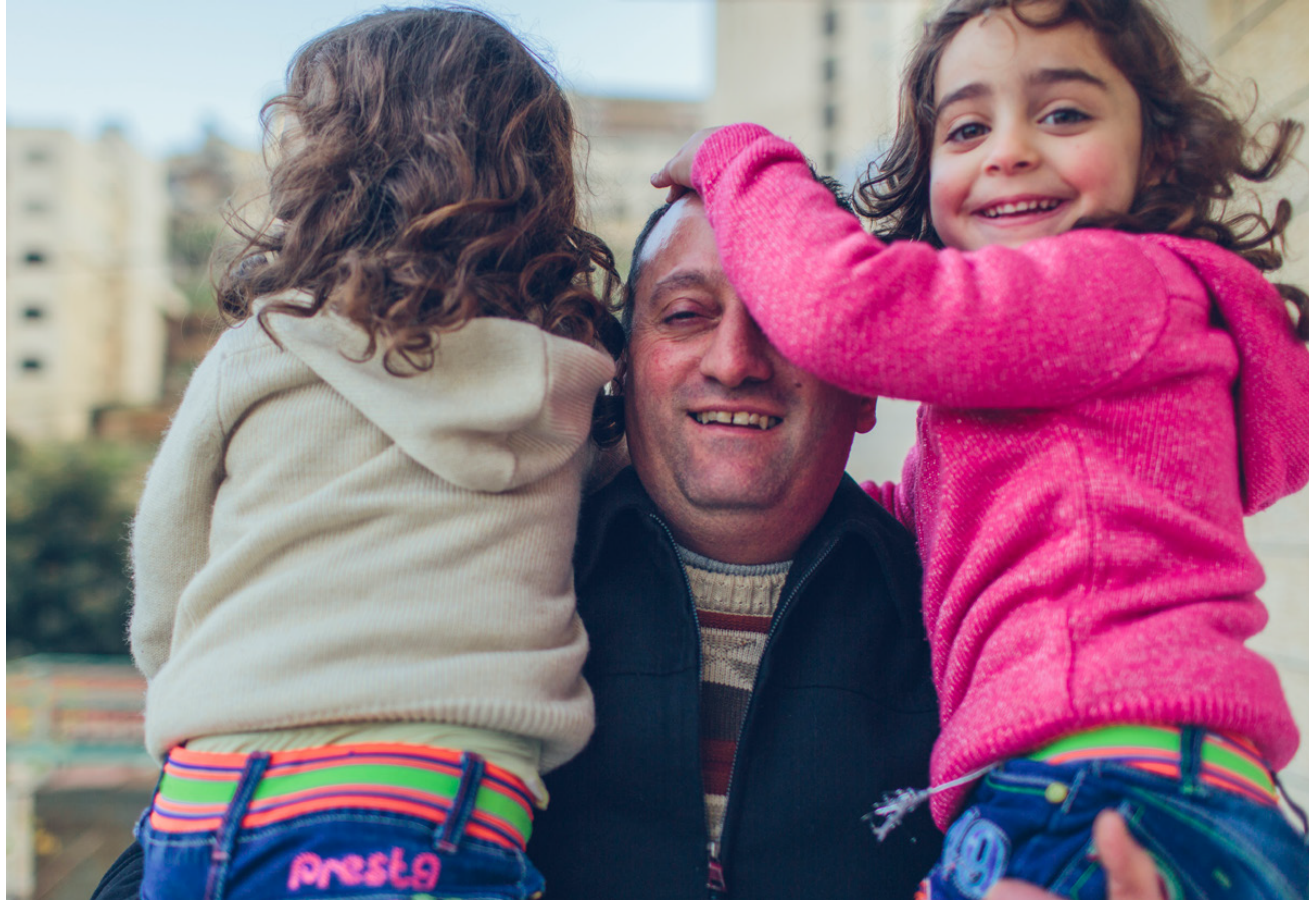
السرد المرئي للقصص (استخدام الرسومات والصور ومقاطع الفيديو)