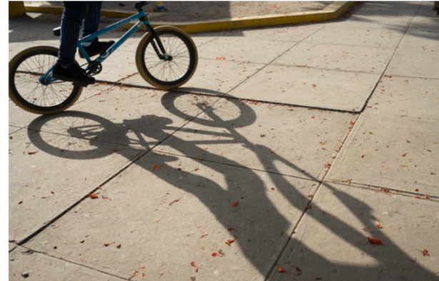
السرد المرئي للقصص (استخدام الرسومات والصور ومقاطع الفيديو)