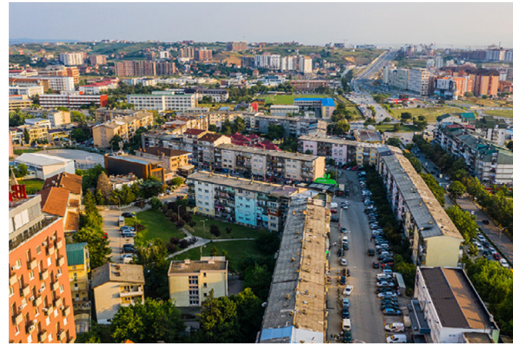
السرد المرئي للقصص (استخدام الرسومات والصور ومقاطع الفيديو)