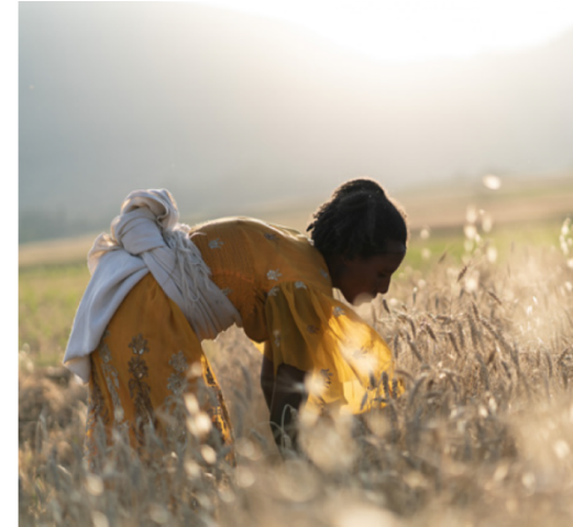
السرد المرئي للقصص (استخدام الرسومات والصور ومقاطع الفيديو)