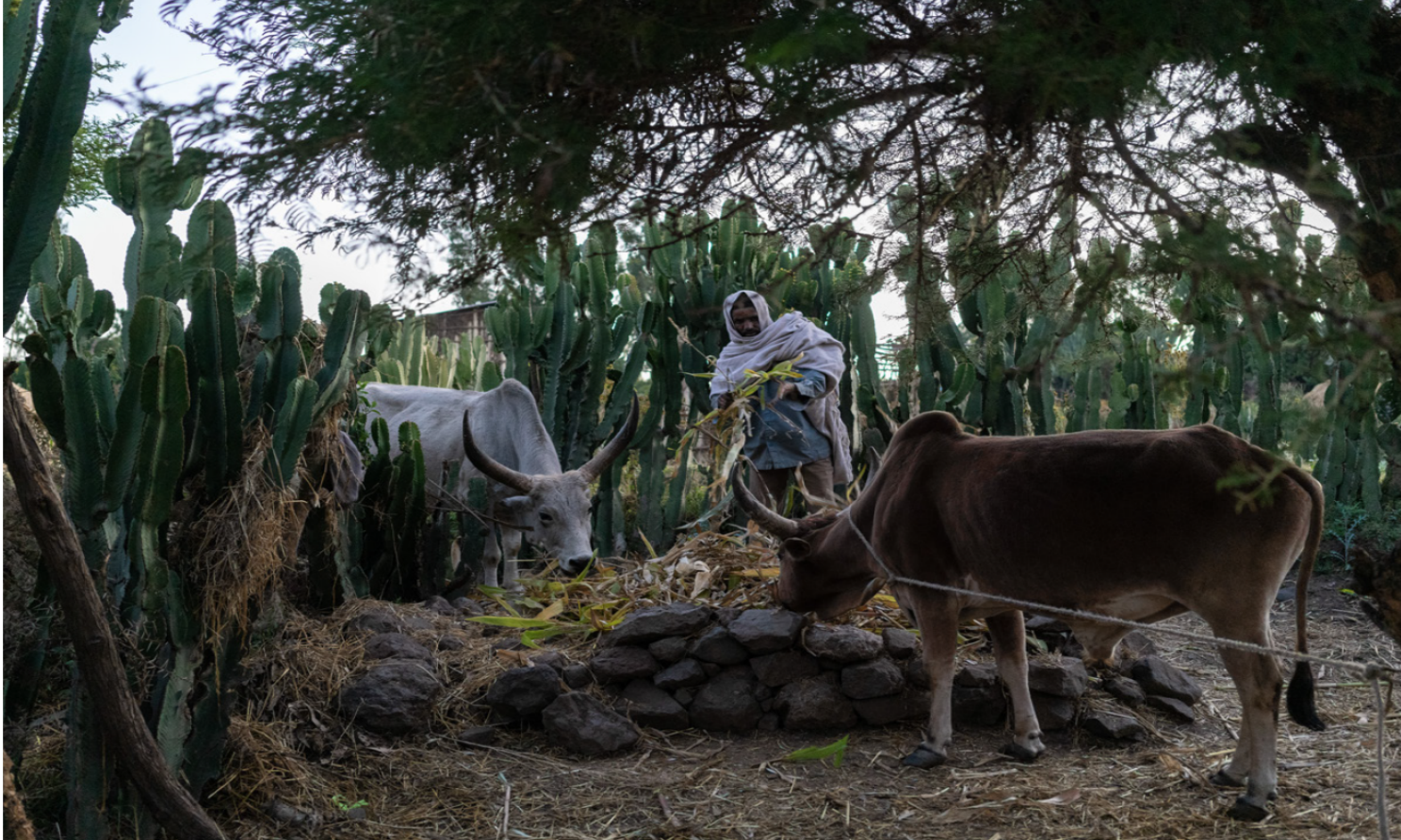
السرد المرئي للقصص (استخدام الرسومات والصور ومقاطع الفيديو)